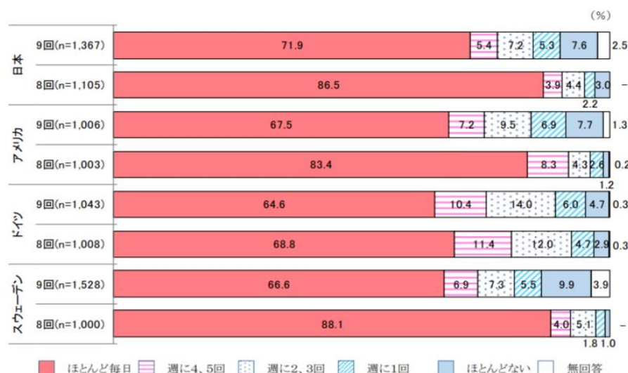
図表1 人と直接会って話をする頻度（第8回比較）

同調査では会話の頻度について、「ふだんの程度、人（同居の家族、ホームヘルパー等を含む）と直接会って話すか」という設問で尋ねている。今回の調査は新型コロナウイルス感染症拡大の中で実施されたため、5年前の調査と比べて各国とも「ほとんど毎日」という回答が減少し、「ほとんどない」が増加する結果となった。日本も他国と同様の結果となっている（図表1）。